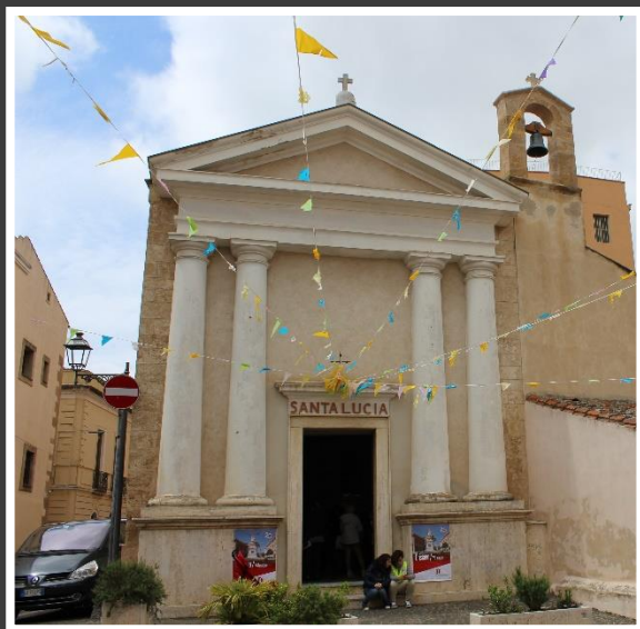
Chiesa di Santa Lucia