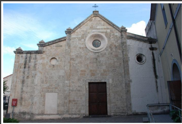
Chiesa di San Martino