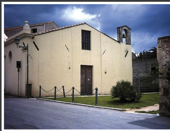
Chiesa di San Mauro